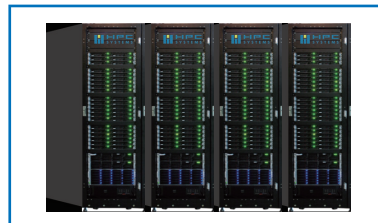
CAEソリューション 小規模から大規模のCAEシステムインテグレーション