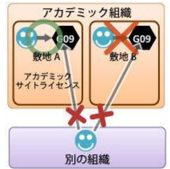
図1. 許可される使用方法